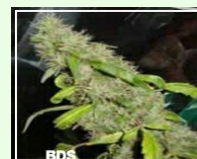
Four Way 85,00EUR